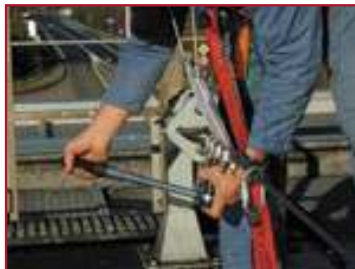
Contrôle de serrage (vérification périodique dans un environnement à fortes vibrations)