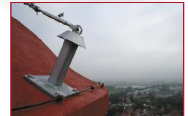
Contrôle des installations sur des sites d'accès difficile