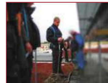
Formation des travailleurs utilisant des E.P.I. contre les chutes de hauteur ( Art. R233-44 du Code du Travail ).

D'autres modules de formation peuvent être mis en place en fonction de besoins spécifiques ( Travaux suspendus et sauvetages, Travaux sur fortes pentes, Installation de lignes de vie provisoires, Montage/utilisation d'échafaudages, Gestes et postures-P.R.A.P., ... ).