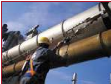
Test d'effort sur ancrage de ligne de vie