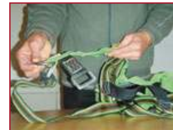
Vérification d'un harnais de sécurité antichute